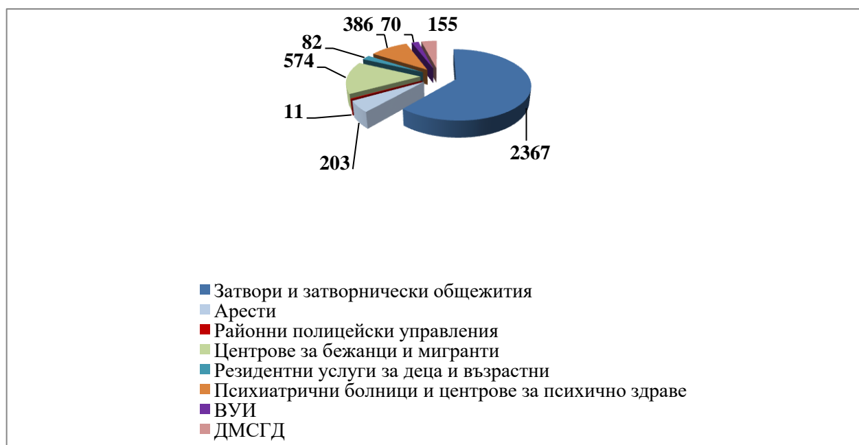
Графика 2 – Брой обхванати лица от проверки на НПМ през 2020 г.